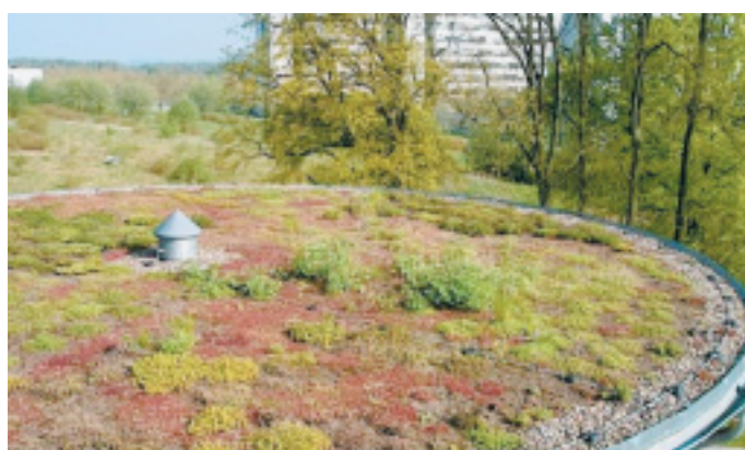
Auch das ist Aufgabe des Dachdeckers: Begrünungen von Flachdächern sind immer gefragter, weil sie das Klima des Hauses verbessern.